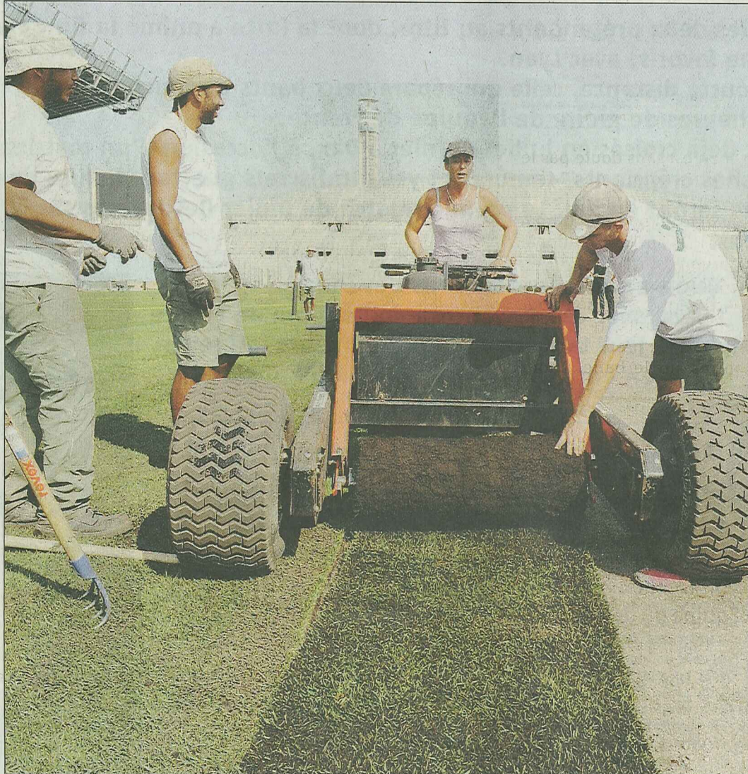
► Le chantier du stade Vélodrome mobilise, au total, vingt-cinq personnes jour et nuit. Entamée lundi, la pose de la pelouse sera terminée demain.

Depuis lundi matin 8 heures, un nouveau tapis vert est déroulé. Son origine ? Bordeaux ! Eh oui, OM-Bordeaux se jouera en sol aquitain... En fait, la mairie de Marseille, propriétaire du Vél, travaille depuis plusieurs années avec une entreprise basée dans la préfec-